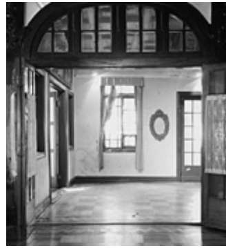
1階旧食堂から広間へ

1949年 東京生まれ 1973年 京都大学卒業 東京大学生産技術研究所村松研究室で日本近代建築技術史を研究 1982年 工学博士 1981年 横浜開港資料館勤務 1997年 文化庁建造物課登録部門主任文化財調査官 2005年~ 文化庁参事官(建造物担当)調査部門主任文化財調査官