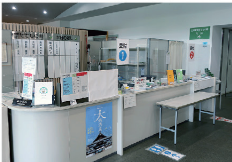
インフォメーションカウンター