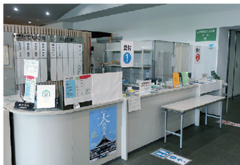
インフォメーションカウンター