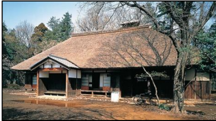
←吉野家外観(体験棟)